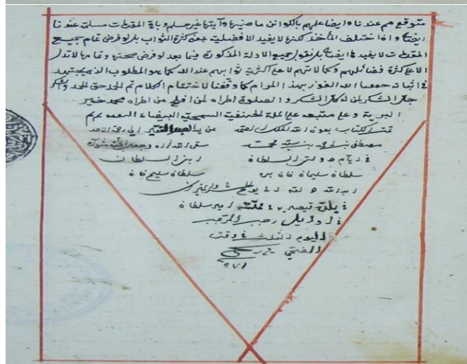
الصفحة الأولى والأخيرة من نسخة (ب)