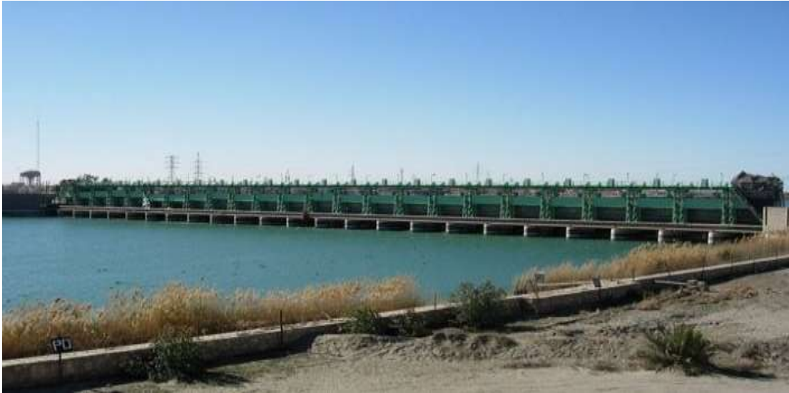
شكل رقم ( ٦ ) صورة من ارشيف مديرية طرق وجسور الانبار