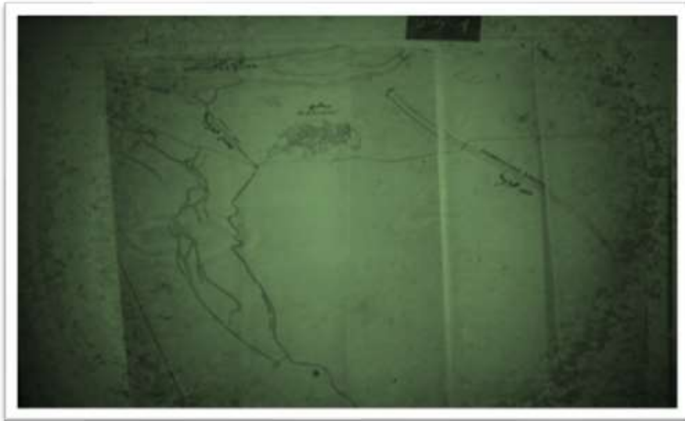
خارطة رقم (٢) العطاءات الخاصة بالشركات المشاركة في تنفيذ مشروع الحبانية