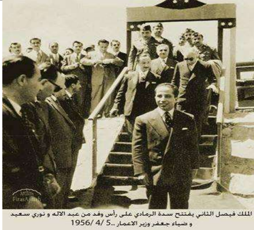
الملك فيصل الثاني يفتتح سدة الرمادي على رأس وفد من عبد الآله و نوري سعيد و ضياء جعفر وزير الاعمار.. 1956/ 4/ 5