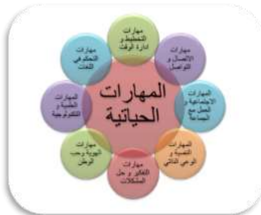
شكل (٢) : انواع المهارات الحياتية