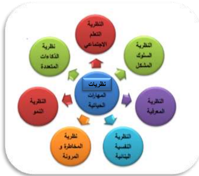
شكل (١) : نظريات المهارات الحياتية

العوامل المؤثرة في اكتساب المهارات الحياتية :