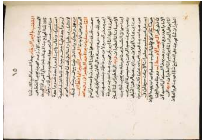
الصفحة الاولى من نموذج (ب)