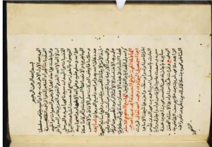
الصفحة الاخيرة من نموذج (أ)